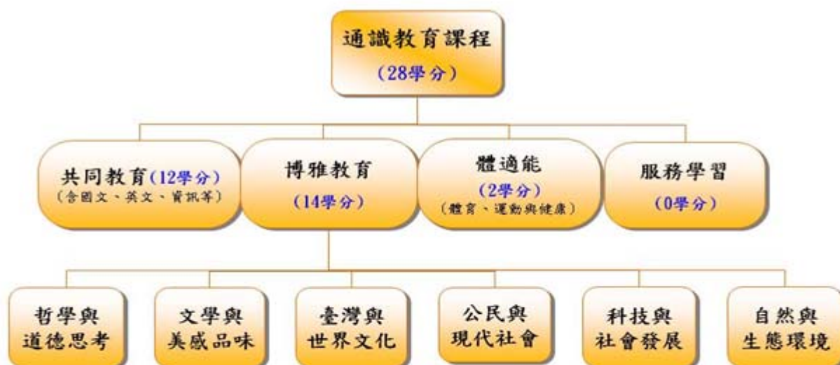
104學年度入學生通識課程架構圖