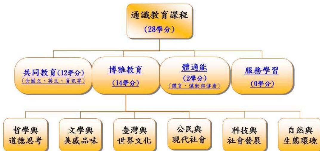
106 學年度通識教育課程架構(日間部)