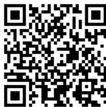
【FB「文創碩實力」 社團 QR Code】