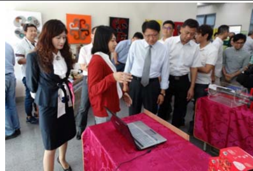
2017 年 11 月 17 日 於屏東縣政府舉辦成果發表會