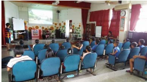
2017 年 08 月 07 日 於屏東縣內獅國小播映屏日足球影片

劇情大綱：2012 年時屏東長治國中曾舉辦台日友好足球交流賽，2016 年藉由台日足球交流賽這個機會，再加上一位來自日本熱愛足球的大學生來推廣足球運動，讓屏東的孩子們能夠慢慢喜歡上足球，希望能夠帶起台日足球的風氣。